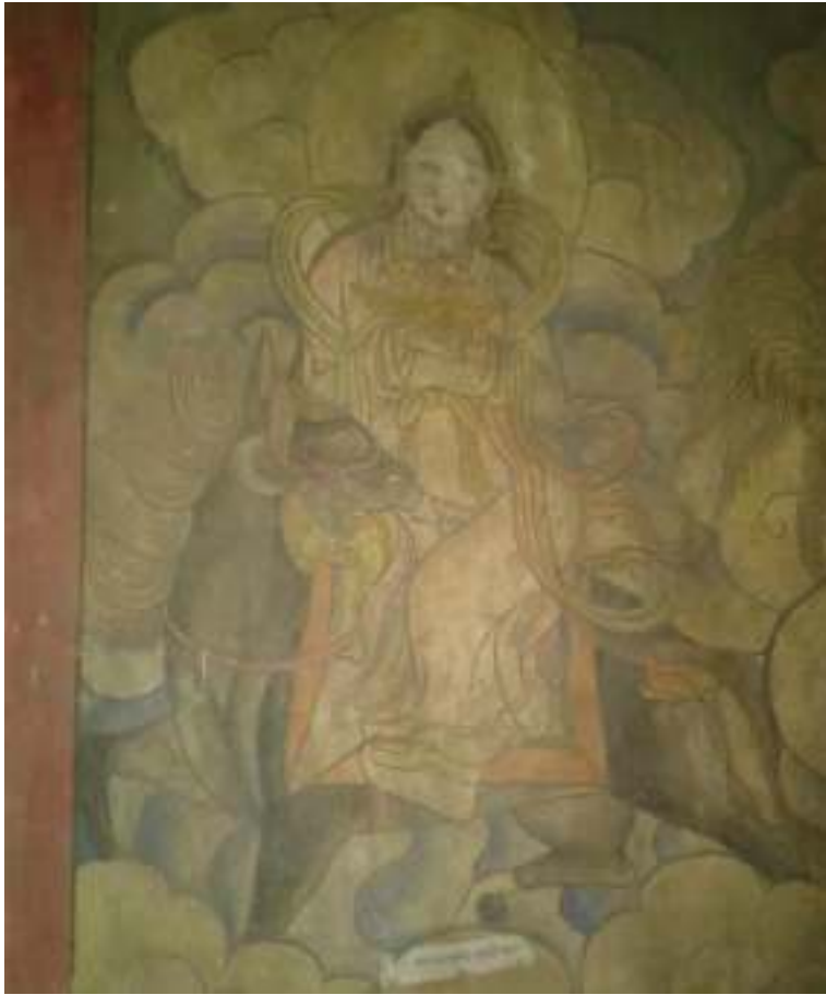
ཕུ་འཁོག་པ་།