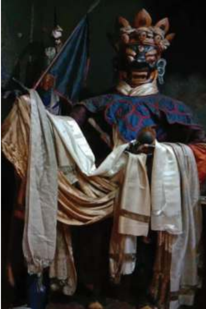
བཙན་མོད་དགའ་རབ་དབང་ཕུག།

སྤྱང་ཉྩེ་ཡུན་བཏན་དུ་གནས་ཐབས་སུ་ གསེལ་བ་བཏབ་དོ་ཡོད་པ་མ་ཚད་ སངས་ རྒྱལ་གྱི་བསྟན་པ་རིན་པོ་ གྲ་ཚང་ཡོད་པ་ལས་འདི་ནང་གི་ བསྟན་འཛིན་གྱི་སྤྱེས་ཆེན་ དམ་པ་ཚུ་སྤྱང་ཞིང་སྤྱོད་བའི་མགོན་སྤྱབས་སྤེ་ཞུ་དོ་ཡོད་པ་ཡིན།