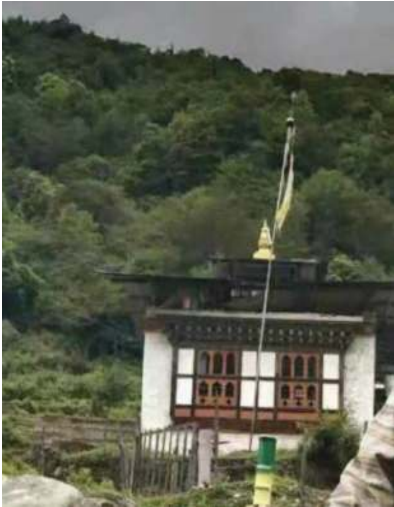
སྤང་འདུས་ ལྷ་ཁང་།