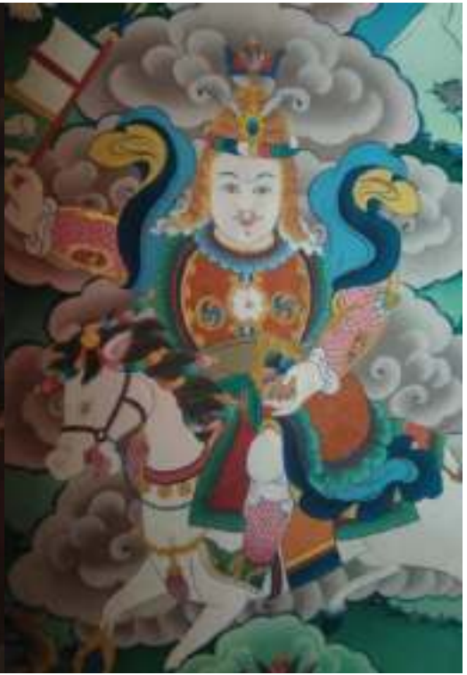
འཁོར་ཤ་ཕང་ལྷ་བཙན་དཀར་པོ།