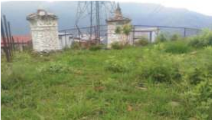
བཙན་མཁར་བྲག་བཙན་དམར་པོའི་ཕོ་བྲང་གི་ཆགས་གནས།

བཙན་ཁར་བྲག་བཙན་དམར་པོའི་གསོལ་མཆོད་ཕུལ་ས་གཙོ་བོ་ རྫོང་ར་བ་ཟེར་སྔོན་དང་ཕུའི་ཁྱིམ་ཤུལ་ཅིག་ ཡོད་པ་ཡིན། མ་གཞི་འདི་ནང་གཞན་ག་ནི་ཡང་མེད་རུང་ སྔོན་དང་ཕུ་གཡུས་ཁའི་མི་ཕུགས་པོ་དང་ གོ་ཤེས་ཉན་ ཤེས་ཅིག་གི་ ཁྱིམ་ཤུལ་ཡིན་མ་བཟུམ་ཅིག་འདུག། འདི་གི་སྐོར་ལས་ལོ་རྒྱུས་ཤེས་མི་ག་ཡང་མིན་འདུག། སྔོན་ དང་ཕུའི་རྫོང་ར་བ་ཡིན་ཟེར་ སྤྲེའི་ནི་ཅིག་མ་གཏོགས་གཞན་ལོ་རྒྱུས་ ཉ་གོ་མི་ག་ཡང་མིན་འདུག། གསོལ་ མཆོད་ཕུལ་ཤ་ད་ ས་གནས་འདི་ཁར་འགྱུ་ཞིན་ན་ མཆོད་དོ་ཡོད་ནི་འདི་གིས་ ས་གནས་འདི་ཁར་བཙན་ ཆགས་ཏེ་ ཡོད་པའི་ངེས་ཤེས་བསྐྱེད་དོ་ཡོད་པ་ཡིན།