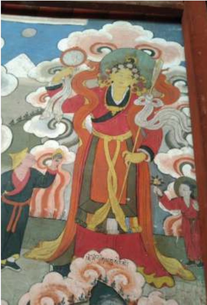
རྩོམ་ལེགས་བྱ་སེར་མོ།