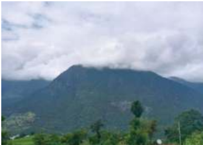
མེ་མེ་ར་ལང་།

གནས་ཁང་ལོགས་སུ་ག་ནི་ཡང་མེད་པ་ཡིན། ཡིན་རུང་ མེ་མེ་ར་ལང་གི་སྤོ་ཏྲག་འདི་གྱར་ བསྐྱེད་འཛིན་གྱི་ སྤྱི་ཆེན་ཚུ་བྱུགས་དམ་གནད་བཞུགས་སའི་མཚམས་ཁང་དང་ དེ་ལས་ ཆོགས་མཆོད་ཕུལ་སའི་གནས་ཁང་ བཟུམ་རེ་ཡོད་པ་ཡིན།