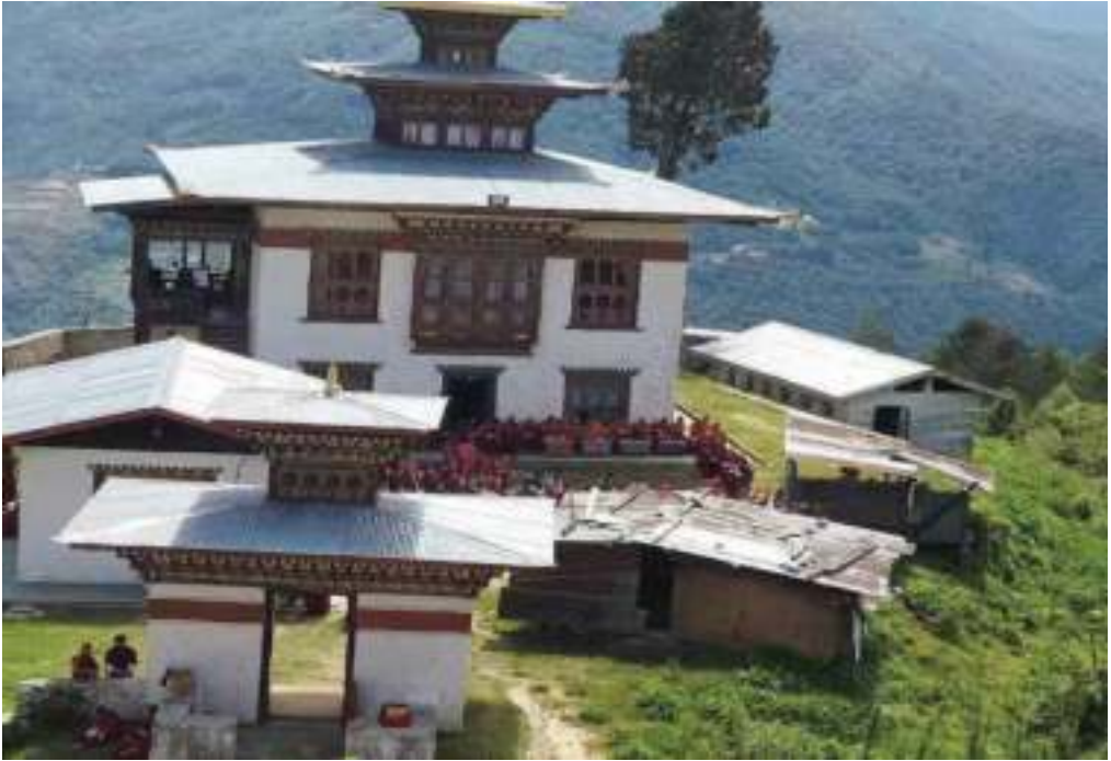
གཡང་ཕེ་སྤུས་གནས་དགོན་པ།

༡ ཡོངས་ལ་ལྷ་བཙན་དཀར་པོ་དང་ཁར་ས་རྒྱལ་པོ་བཙན་གྱི་མིང་། མིར་སློ་བྲག་བཙན་དམར་མོ་དང་གཙང་ཆེན་གནས་སྤང་།