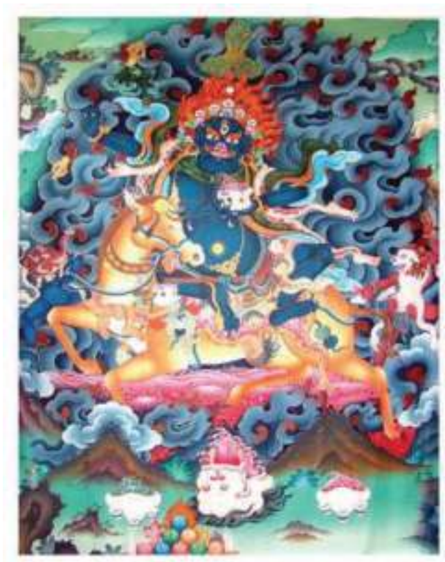
དཔལ་ལྷན་ལྷ་མོ་དམག་ཐོར་མ།