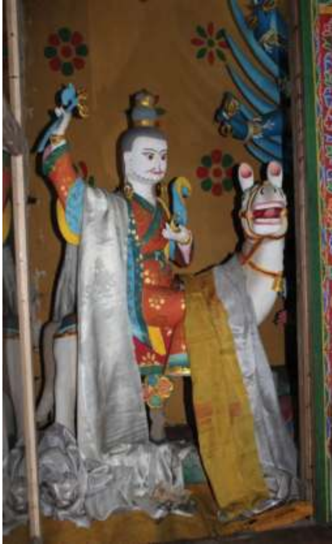
ཡུལ་བཙན་གནམ་ཤིང་པ།

བྱུགས་འདི་ནང་གི་གཞི་བདག་འབད་བཞུགས་དགོས་པའི་གསེལ་བ་བཏབ་གསེལ་མཆོད་ཕུལ་ཏེ་ཡོད་པ་ཨིན། དེ་ཡང་ གྱེ་ དམ་ཚིག་གཙང་མའི་གནས་མཆོག་འདིར། །བཞུགས་པའི་གནས་སུ་དངས་རེ་སྟོ། །གཞི་བདག་ ཆེན་པོ་འཁོར་དང་བཅས། །མཐུན་པའི་སྟན་ལ་བག་པོག་ཅིག །ཅེས་ཟེར་གསུངས་ཡོད་པ་བཞིན་ནོ།།