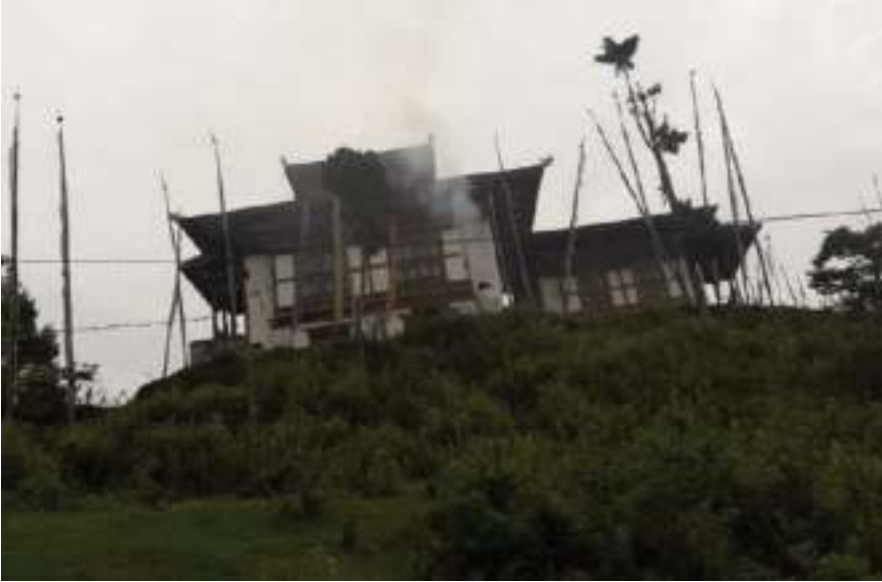
རབ་སྟེ་ཐུམ་བྲང་ལྷ་ཁང་།