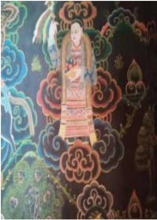
ཡུམ་ སྒྲུབ་བྱ་ཨ་ཁྱེ་མི་སྟོན།