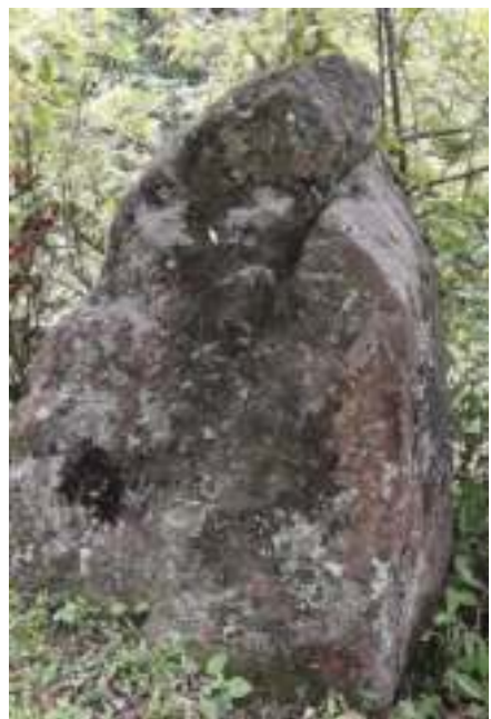
བཙན་གྱི་དམར་གཏོར། བཙན་གྱི་བཞུགས་ཁྲི།