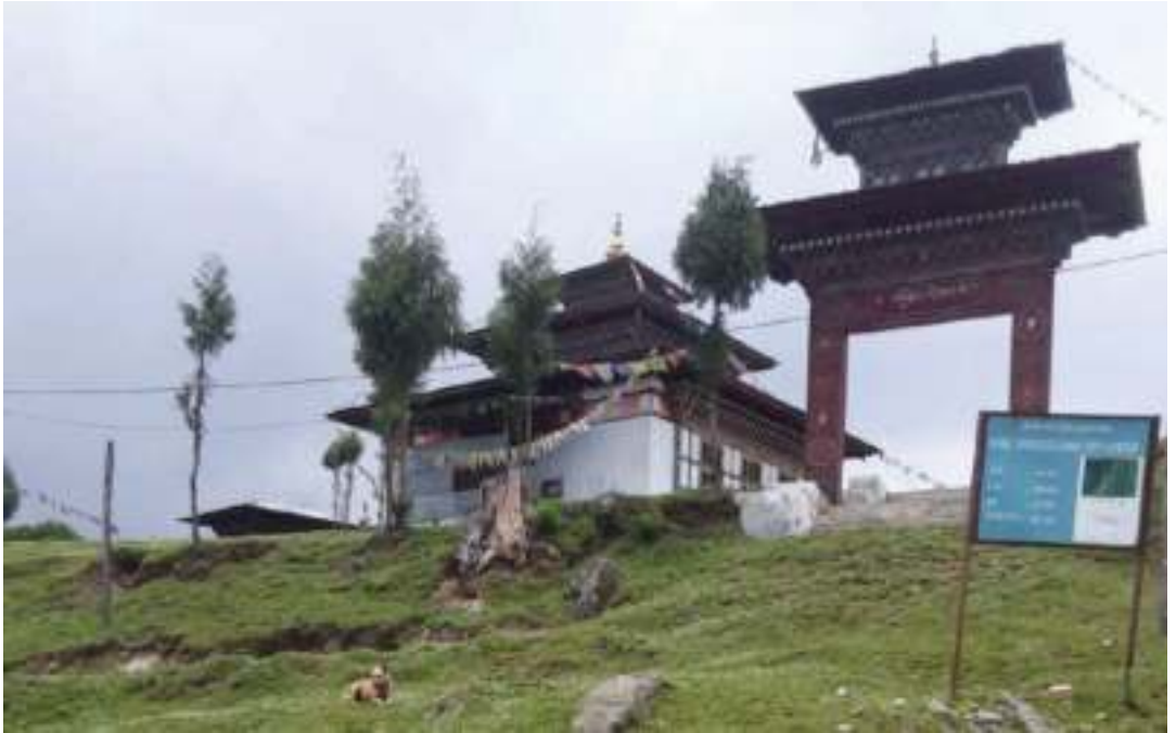
གསེར་ཕུ་བཙན་གསོལ་མཆོད་ཕུལ་སའི་ལྷ་ཁང་ ལྷག་ཕྱེ་མ།