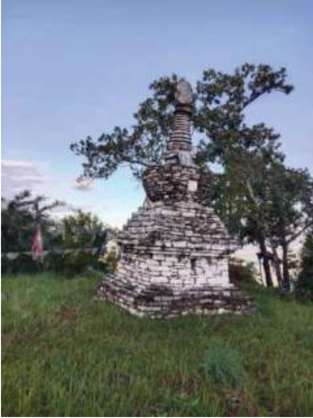
དུང་ཕུ་ བཀའ་དམ་མཆོད་རྟེན།