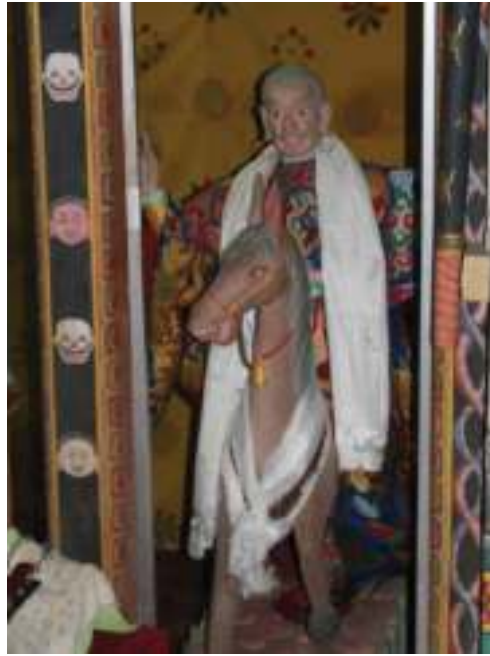
གཞི་བདག་ས་མཁར་པ།