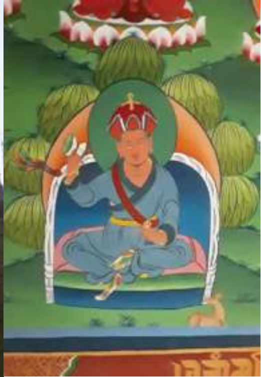
གཞི་བདག་ཇིསི་སྤུའམ་ དགེས་སྤྱ།