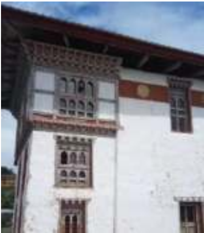
ལྷན་གྲུབ་ཅེ་ལྷ་ཁང་།