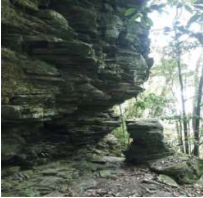
དབང་ཕུག་ཆེན་པོའི་ཕོ་བླང་།