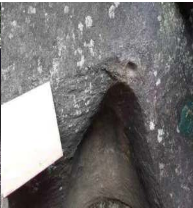
ཁྱེན་རིན་པོ་ཆེ་གི་ཕྱག་བཅས།