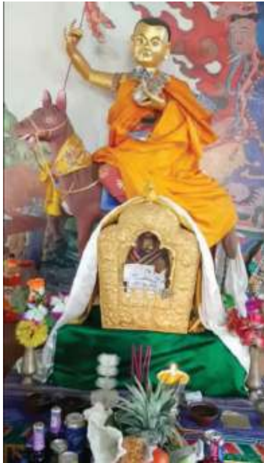
མཐོང་ཕུ་བཅན།

སྔན་མ་གྲམ་ཁོ་ར་ཞལ་བཞུགས་པའི་བསྐྱང་ལས་རང་ བསྐྱན་པ་དང་སེམས་ཅན་གྱི་དོན་ལུ་ ཐུགས་སློན་ཚུ་ གནང་སྟེ་མགོན་སྐབས་གྱི་དོན་ལས་ གསོལ་མཆོད་ཚུ་ཕུལ་ཏེ་ཡོད་ནི་འདི་གིས་ ད་རིས་ནངས་པར་འབད་རུང་ གཡུས་ཁའི་མི་ཚུ་གིས་འབད་རུང་ གསོལ་མཆོད་ཚུ་ཕུལ་ཏེ་ མགོན་སྐབས་ལྷམ་ལྷམ་རང་ཨིན།