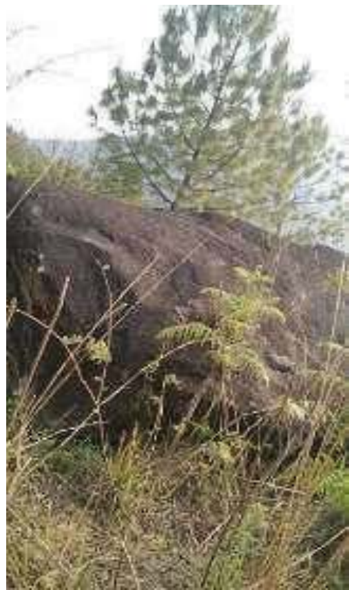
གནས་ཁང་ངམ་ཕོ་བྲང།