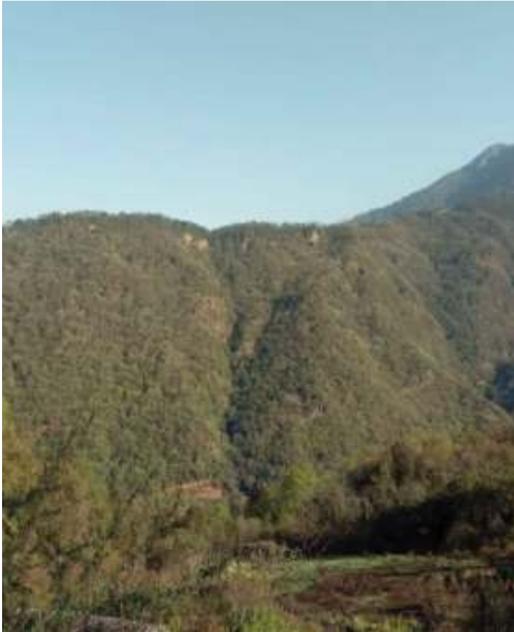
ཐང་དཀར་བྲག་བཙན་གྱི་ཕོ་བྲང་།