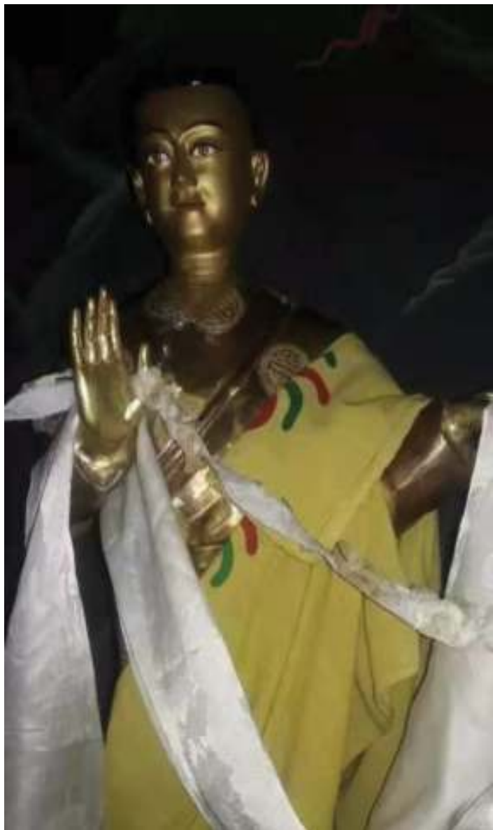
དགའ་རབ་དབང་ཕུག་གི་སྐུ་བཞེན་ལེགས་གཞོན་ལྷ།

གཡོན་ཆས་བཞེན་སྟོད་ལ་ཅི་འདོད་ཡིད་བཞེན་སྟེར་བའི་ཞོར་བུ་བཀའ་བའི་གཞོང་པ་ཐོགས་པ། ཆིབས་སུ་རབ་ ཏུ་འཇིགས་པའི་ར་ནག་ལ་གཞོན་ནས་ སྟོང་གསུམ་རྒྱུད་ལྷགས་དྲག་པོའི་ཏུར་སྐྱ་དང་བཅས་པས་ ཡུད་ཀྱིས་ བསྐྱོར་བ། སྐུ་ལ་བཅན་ཁབ་དང་ལྷགས་ཆོག་གསོལ་ནས་ དཔའ་བོའི་རྟགས་ཆས་ཀྱིས་རབ་ཏུ་བརྒྱན་ཏེ་སྟོབས་ ཟིལ་མཚུངས་པ་མེད་པའི་ཉམས་དང་ལྷན་སྟེ་བཞུགས་ཡོད་པ་ཨིན་པས།