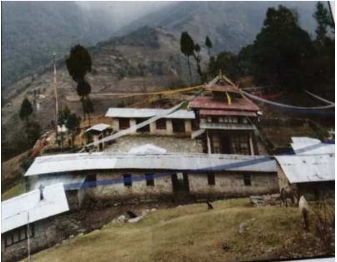
རྒྱལ་པར་སྤྲ་མའི་དགོན་པ་འཕམ་ (ལྷ་མ་གྲུབ་བསམ་གཏུན་ཆོས་གླིང་དགོན་པ།)

རྒྱལ་གྱི་བསྟན་པ་དང་སྒོས་སུ་ དཔལ་འབྱུག་པའི་བསྟན་པ་ལུ་དབུ་འཕངས་སྤྲད་པའི་གཞོན་ཕྱེད་དག་བགེགས་ གཏུག་པ་ཅན་ཐམས་ཅད་ ལྷ་དུ་སྒྲོལ་བའི་འཕྲིན་ལས་བཅོལ་ནུས་པའི་སྤྲང་མ་ཅིག་ཡིན་པའི་ཚུལ་ དེ་ཡང་། རྗེ་ ལྷ་འབྱུག་ཆེན་པོ་འཛིན་ཕྱེད་རྩ་ལ། །མི་བསྟན་ལས་ལ་ལྷ་མཛད་གཏུག་པ་ཅན། །ཐུབ་པའི་སྤྲོན་སྲར་ དམ་བཅས་མ་གཤེལ་བར། །རྣལ་འབྱོར་བཅོལ་བའི་འཕྲིན་ལས་ལྷ་དུ་སྤྲུབས། །ཅེས་གསུངས་ཡོད་པ་བཞིན་ ཡིན་ནོ།