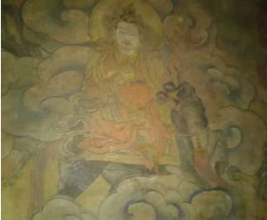
མདའ་འཆམ་པ།

མདའ་འཆམ་པ་དེ་སྤྱིར་བཏང་གསོལ་མཚན་ལ་སོགས་པ་ཕུལ་བའི་སྐབས་ སློ་རང་ཅེ་དགོན་པའི་ནང་ལུ་ཕུལ་དོ་ ཡོད་པ་ཡིན་རུང་ གནས་ཁང་ངམ་ མོ་བྲང་དེ་ ས་གནས་ཉག་ཐོར་སྟེང་ཟེར་སའི་ ལམ་གྱི་ཉེ་འདབས་ལུ་ཡོད་ པའི་ཤིང་ཆེན་མཐོང་སར་ཡིན།