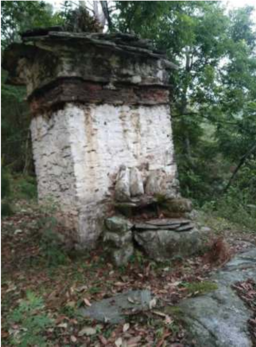
བུང་ཕུ་ཨ་མའི་བཀའ་དམ་མཆོད་རྟེན།