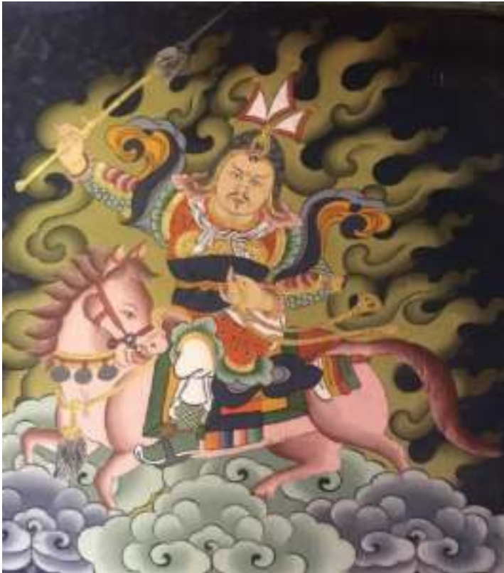
རྒྱལ་ཕུའི་ལྷ་བཙན་དཀར་པོ།

རྒྱལ་ཕུའི་གཡལ་སྒྲིག་ལས་མར་ སྤངས་ཐང་ཉམས་དགའ་བ་ཅིག་གི་སྤྱིང་དུ་(མཆོ་གནས་མ) ཟེར་ས་ལུ་ ལོ་ ལུ་བཅུའི་སྤྱོད་ལ་རྒྱལ་ཕུའི་ལྷ་བཙན་གྱི་བླ་མཆོ་མ་བསྐྱམ་པར་ཡོད་རུང་ གསོལ་མཆོད་དང་བདག་འཛིན་འཐབ་ མི་མེད་པར་ ད་རེས་ནངས་པ་ སྐམ་ནི་ཉེན་ལག་གྱུར་སྟོད་པ་ལས་བརྟེན་ མི་ཚུ་གིས་སྤང་གིབ་དང་མི་གཙང་བ་ ཚུ་ རྒྱ་འབྲུ་ནི་འདི་གིས་གིབ་ཐོག་ཏེ་ སྐམ་སོང་བའི་ལོ་རྒྱུས་སྟེ་བཤད་ནི་ཡོད་པ་མ་ཆད་ ད་རེས་མཆོ་ཡོད་ས་ལུ་ འདམ་རྩལ་ཉལ་ཉལ་ཞིག་ཡོད་པ་མཐོང་མ་ལས་ བླ་མ་ཆོས་སྤྱིང་འཛིན་འགོ་དཔོན་ལས་ གསོལ་མཆོད་དང་ བདག་འཛིན་ལེགས་ཤོས་འཐབ་པ་ཅིན་ ལོག་སྟེ་རང་ འཆོ་ཆགས་ནི་བཟུམ་ཅིག་འདུག་ཟེར་མཉམས་སྟེ། ད་རེས་ བླ་མ་ཆོས་སྤྱིང་འཛིན་ འགོ་དཔོན་གྱིས་འགོ་འདྲེན་འཐབ་ཏེ་ མཐའ་སྐོར་ཚུ་གཙང་སེལ་བཟོ་སྟེ་ ད་རེས་ ནངས་པར་ ལོག་སྟེ་རང་མཆོ་རྒྱུ་ཅིག་འབྱེད་ཏེ་ཡོད་པའི་ལོ་རྒྱུས་འདུག།