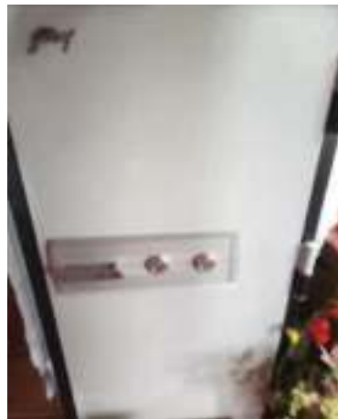
གཞུང་བཙན་གྱི་ཕོ་བྲང་ ཀོ་སྒྲོམ་བཞུགས་ཁང་།