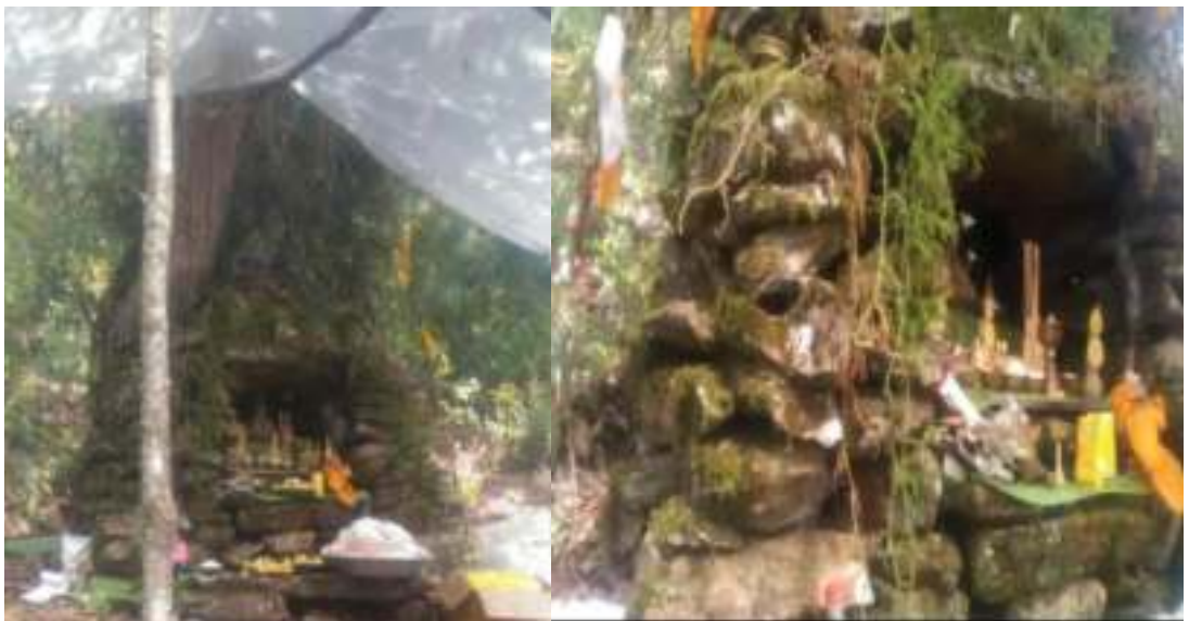
ཤ་རང་བཅན་ལུ་གསོལ་མཆོད་ཕུལ་ཐངས་ཀྱི་པར་རིས།

འབད་སྲོལ་ཡོད་མི་ཅིག་ཡིག་ཐོག་ལུ་མདོར་བསྡུས་སྟེ་བཀོད་པ་ཅིན། ཁམས་དངས་གཡུས་ཚན་མི་སེར་ཚུ་གིས་ ལོ་ཐོག་བཟབ་ རན་མ་ད་དང་ ཆར་ཚུ་རེ་དགོ་པའི་སྐབས་དང་ ཆར་པ་བཅད་དགོ་པ་རེ་ཐོན་འབདཝ་ད་ སྤྱོད་དང་ཕུ་ལས་བསྟེན་སྲོལ་ཡོད་པའི་ ཡུལ་བཅན་ཅིག་ཨིན་པས། བཅན་དེ་དང་འབྲེལ་བའི་ལོ་རྒྱུས་གནམ་མེད་ས་མེད་ཅིག་བཤད་ནི་ག་ནི་ཡང་མེད་པ་ཨིན། ཨིན་རུང་ སྤྱིར་བཏང་ གི་ལོ་རྒྱུས་འབད་བ་ཅིན་ ཁམས་དངས་གཡུས་ཚན་གྱི་གུ་ལུ་ཕུ་ཅིག་ཡོད་མི་འདི་ལུ་ཡུལ་བཅན་དེ་གནས་ཏེ་ ཡོད་པ་སྟེ་ཨིན་པས། དེ་འབད་ནི་འདི་གིས་ ཕུ་འདི་གིས་དབང་བའི་ཁམས་དངས་ཆེད་འོག་གི་མི་སེར་ཚུ་ལོ་ལྟར་ ཨ་རྟག་ར་འབད་སྲོལ་ཡོད་པའི་ལཱ་ ག་ཅི་རང་འབད་རུང་ ཤ་རང་བཅན་དེ་ལུ་གསོལ་མཆོད་ཕུལ་དགོ་དོ་ཡོད་པ་ ཨིན། དེ་ལས་ ཨ་ལོ་གསར་སྤྱོད་ཚུ་ཡང་ གོང་ལུ་བཀོད་དེ་ཡོད་པའི་ལྟ་ཁང་དེ་ནང་ ཤ་རང་བཅན་ལུ་གསོལ་ མཆོད་ཕུལ་དགོ་དོ་ཡོད་པ་ཨིན། སྐྱུ་མདོག་ཕུག་མཆོན་གྱི་སྒོར་ལས་ ངག་ཐོག་ལོ་རྒྱུས་ཤེས་མི་ག་ཡང་མེད་པ་ མ་ཆད་ གསོལ་ཁའི་དཔེ་ཆ་ནང་ལུ་འབད་རུང་ ཁ་གསལ་ག་ནི་ཡང་མེད་པ་ལས་ ལོ་རྒྱུས་ལོགས་སུ་ག་ནི་ཡང་ བཀོད་དེ་མེད་པ་ཨིན།