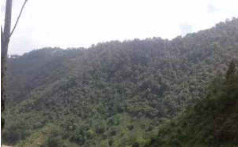
ཁ་རུང་བཙན་གྱི་གནས་ཁང་།

གསུམ་འཛོམས་པའི་ཁ་རུང་རི་བོའི་རྩེ་ལུ་རྒྱ་ཆུ་འཛིན་སྤྲིན་ནག་འཁྲིག་པའི་གྲར་ཁང་ རྒྱ་གསེར་ལས་གྲུབ་པའི་ཕོ་ བང་ནང་ལུ་ ཁ་རུང་བཙན་འཁོར་དང་བཙས་ཏེ་བཞུགས་ཡོད་པ་ཡིན་པས།