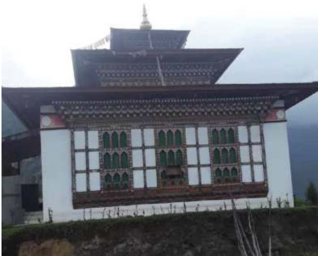
འཇམ་མཁར་ སྟག་ཕྱེ་མའི་ལྷ་ཁང་།