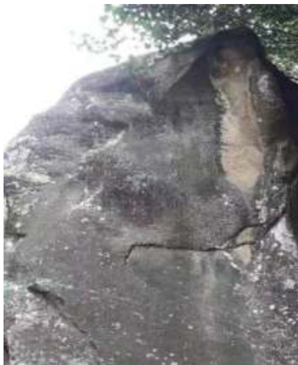
ལྷ་བདུད་ཏི་པ་ར་ཇའི་ ལོག་སྒོད་པའི་སྤར་རིས།