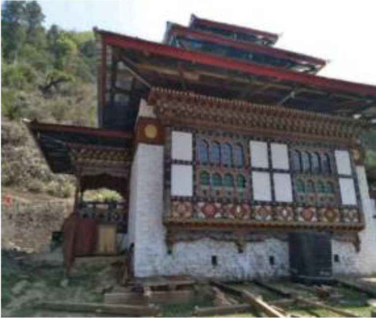
སྤྱག་སྤྱི་པ་རྒྱ་ཚོས་སྤྱིང་ལྟ་ཁང་།