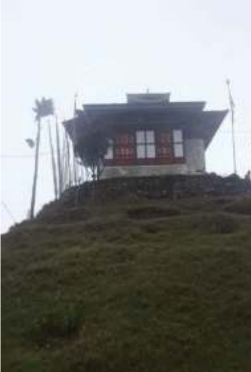
བསམ་གཏན་ཚེས་གླིང་ལྷ་ཁང་།