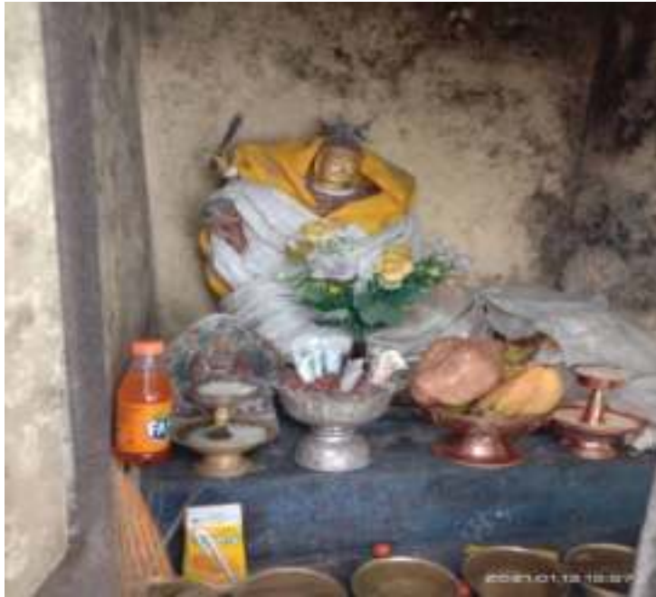
ཡུལ་བཙན་གཞི་བདག་མི་བུ་ལ།