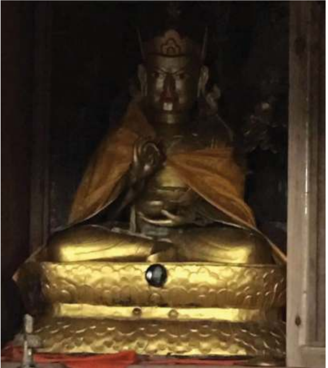
སྒང་ཁར་ སངས་ཀྱིས་སྤང་དགོན་པའི་ནང་ཉེན།