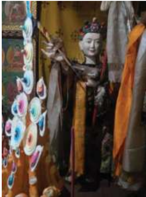
གཙང་ཆེན་གནས་སྤྱང་མཆོ་སྤྲོད།