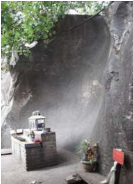
ཨྱོན་རིན་པོ་ཆེའི་སྐུ་རྩེས།

པའི་གླིང་ལུ་ སྟོན་མ་ལས་གཞི་རིམ་སྟོབ་བྱ་ཡོད་པའི་ཁར་ སྐབས་ཅིག་ལས་ཤར་ཕྱོགས་ཁ་ཐོག་གི་ཕྱིས་གཞུང་ རྩེ་བའི་སྟོབ་བྱ་ཅིག་ཡང་གཞི་བཙུགས་འབད་དེ་ཡོད་པ་སྟེ་ དབུ་འཛིན་གྱིས་གསུངས་ཡོད་པ་ཨིན། དེང་རབས་ཀྱི་འགྱུར་བ་ལས་བརྟེན་ གནས་བདག་དེ་ བསྟེན་མི་དང་མ་བསྟེན་མི་ཁྱད་པར་འབད་བ་ཅིན། ཉེ་ མ་དང་ད་རེས་ནངས་པར་ ཏུས་ཀྱི་འགྱུར་བ་ལས་བརྟེན་ག་དེ་སྟེ་འགྱོ་དོ་ཡོད་པ་སྟོ་ཟེར་བ་ཅིན་ སྟོམ་ཕུག་གླིང་ པའི་གླིང་གི་གནས་བདག་ལུ་བསྟེན་མི་འདི་ ཉེ་མ་དང་ཕུད་པ་ད་ ད་རེས་ནངས་པ་ མི་མངམ་གིས་རང་ རང་ གི་ལམ་འགོ་ལེགས་ཤོམ་འགྱོ་ནི་དོན་ལུ་ གནས་བདག་ལུ་གཙོ་བོ་བརྟན་ཉེ་ཡོད་པའི་ལོ་རྒྱུས་སྟོམ་ཕུག་གླིང་ པའི་གླིང་གི་ སྟོབ་དབུ་འཛིན་གྱིས་བཤད་ཡོད་པ་ཨིན། དེ་ཡང་གོང་ལུ་བཀོད་དོ་བཟུམ་སྟེ་ གནས་བདག་དེ་ སྤལ་དང་མུར་ཏུ་རྒྱབ་སྐྱོར་མཛད་མི་ཅིག་འབད་ནི་འདི་གིས་ མི་ཚུ་གིས་ཏ་གོ་སྟེ་བསྟེན་དོ་ཡོད་པ་ཨིན་པས།