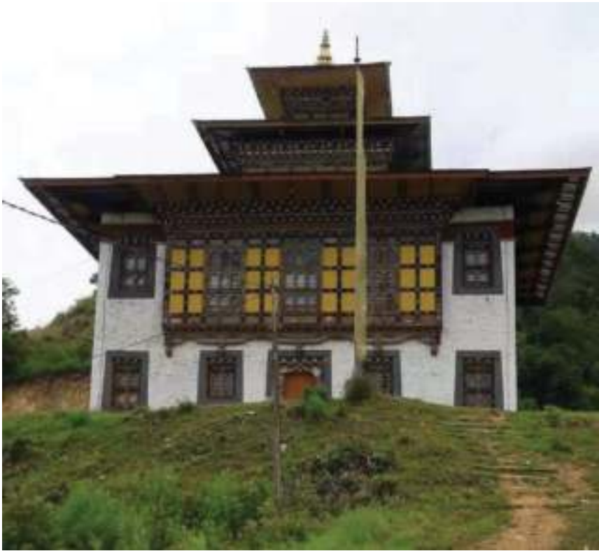
གསོལ་མཛོད་ཕུལ་སའི་ལྷ་ཁང་།

བསྐྱེན་དགོདོ་ཡོད་པ་ལས་ ཡུལ་བཙན་འདི་གིས་མགོན་སྐྱབས་མཛད་དོ་ཡོད་པ་ཡིན། གསོལ་ཁའི་དཔེ་ཆ་ ལས། མི་ལ་ན་ཚ་མ་བཏང་ཅིག །ཕྱགས་ལ་རྒྱུ་ལ་མ་བཏང་ཅིག །ཞིང་ལ་སད་སེར་མ་བཏང་ཅིག །ཅ་དང་མུ་ གེ་མ་བཏང་ཅིག །རྒྱལ་འབྱོར་བདག་ཅག་འཁོར་བཙས་ལ། །ཕྱོགས་ནི་གར་འགྲོ་གར་སྔོན་ཀྱང་། །མདུན་ནས་ བསུ་ལ་རྒྱབ་ནས་སྒྲོལ། །ཞེས་གསུངས་པ་བཞིན་ མི་ནོར་ཕྱགས་གསུམ་གར་གི་མགོན་སྐྱབས་མཛད་ནི་ལུ་མེད་ ཐབས་མེད་པ་ཡིན་པས།