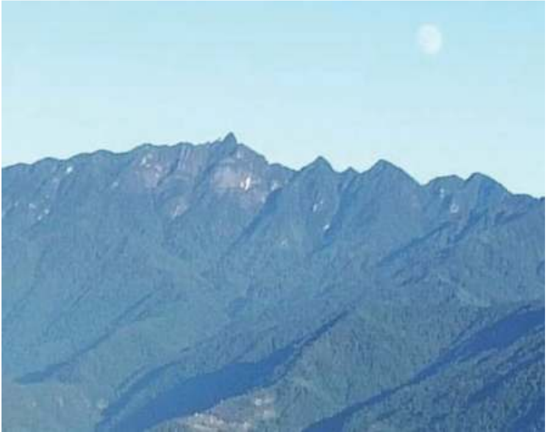
ཆོང་ཆོང་མའི་ཕོ་བྲང་།

དབང་འདུས་ཀྱིས་ གོང་འཕེལ་གྱི་དོན་ལས་མ་དངུལ་གནང་སྟེ་ ཉེ་མ་ཡོད་མི་ལྟ་ཁང་དེ་རྒྱ་བསྐྱེད་འབད་དེ་སྤོམ་ སྟེ་རྒྱབ་སྟེ་འདུག།