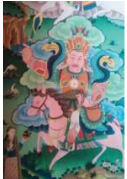
ཐང་དཀར་བྲག་བཙན།

ཐག་དཀར་བྲག་བཙན་དཀར་པ་དང་ཕུག་གི་གསོལ་མཚོད་གྱི་ བསྟོན་པ་ལས། སྐྱུ་མདོག་དམར་པོ་ཁྲག་རལ་ཅན། །ཞལ་གདངས་ མཆེ་གཅིགས་སྤང་མིག་རྒྱས། །ཕུག་གཡུས་གནམ་ལྷགས་རལ་གྱི་ ཡིས། །དབྱ་སྟགས་དུམ་བྱར་གཅོད་ལ་བསྟོན། ། གཡོན་པ་འདོད་ ཡོན་ཞགས་པ་བརྒྱམས། །སྤྲེལ་གྱོན་ཡིད་འཚོམས་ཤིང་ འགྲུགས། །ལྷགས་ཚོགས་རུ་དར་དབུ་ལ་གསོལ། །གོ་ཁབ་དམག་ཆས་