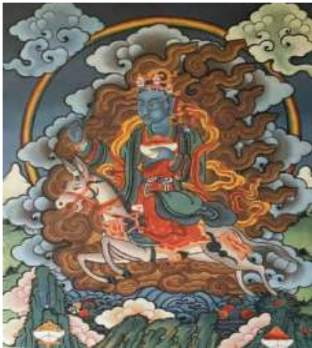
ཨ་མ་ཇོ་མོ།

བརྒྱད་ལས་ཡར་ཅད་འོང་དོ་ཡོད་པ་ལས་ཇོ་མོ་ཤོ་བྱང་དེ་ཁར་འབག་གི་བ་ལ་སོགས་བཀལ་བ་ཅིན་མི་ནོར་གྱི་ རིགས་གར་ལུ་གཞོན་རྒྱུན་འབྱུང་ནི་ཨིན་མ་ལས་ཨམ་སྤྱོ་ལོ་བརྒྱད་ཡན་ཆད་ལུ་འགྱོ་སྤོལ་མེད་པ་ཨིན་པས།