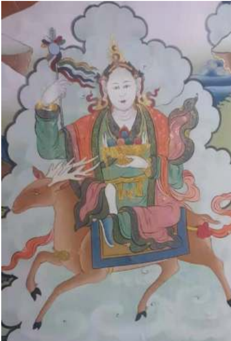
མདའ་བྱང་དཀར་མོ།