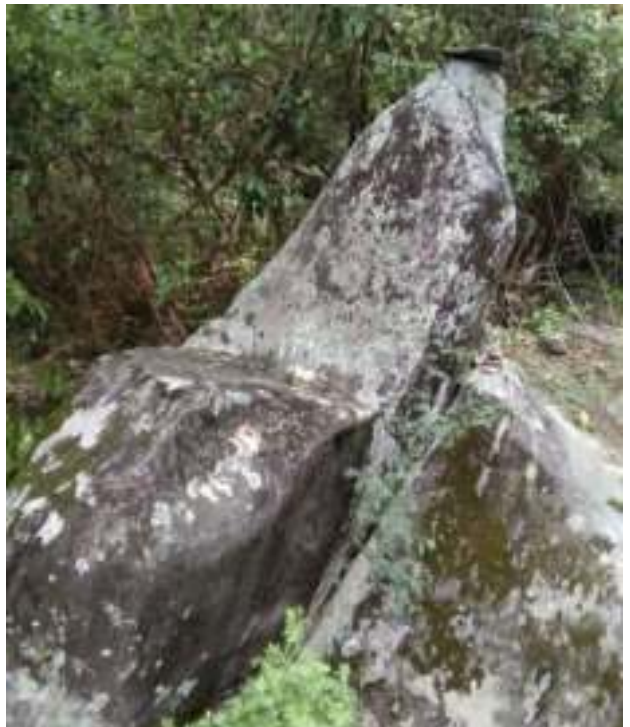
དུང་ཕུ་ཨ་མའི་བཞུགས་ཁྲི།

དུང་ཕུའི་བཙན་གྱི་སྟོར་ལས་ལོ་རྒྱུས་རྒྱས་ཤིང་ རྒྱས་པ་སྟེ་ག་ནི་ཡང་མིན་འདུག། ཡིན་རུང་བཙན་ དོན་བཟུམ་ཅིག་ཡིན་པ་ཅིན་ དུང་ཕུ་ཟེར་བའི་ བཙན་དེ་ དགོ་སྟོང་ཅིག་ཡིན་པའི་ལོ་རྒྱུས་འདུག། དེ་འབདམ་ད་ ཡུལ་བཙན་དེ་དང་འབྲེལ་བ་ཡོད་ པའི་དོའི་བཞུགས་ཁྲི་ཅིག་འདུག། འདི་ལུ་མི་རྩ་ གིས་དུང་ཕུ་ཨ་མའི་བཞུགས་ཁྲི་ཟེར་ མའི་མིང་ བཏོན་ཏེ་སྟེབ་སྟོལ་འདུག། འདི་གི་སྟོར་ལས་ ཁུངས་ཡང་དག་བཀའ་མི་ཅིག་ག་ཡང་ཕུད་མ་ རྩུགས།