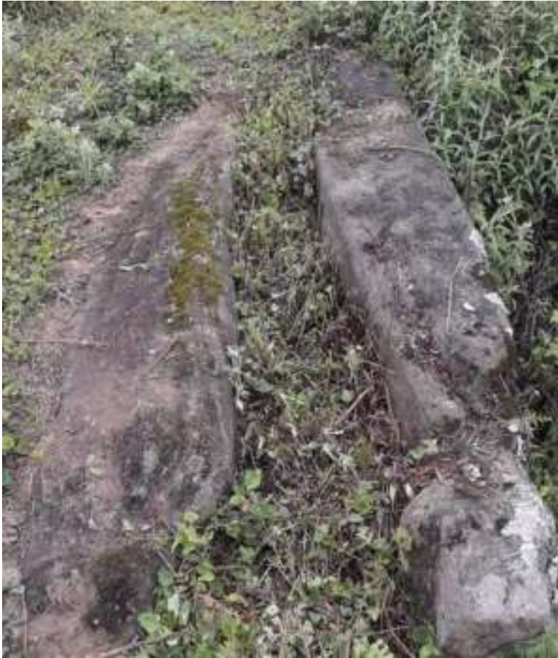
བཅན་གྱི་སྒོའི་བསྐྱམ་སྟེ་གནང་སྟངས།

ཁག་ཡོད་པ་ཅིན་ ལོ་ཚྭ་ཡང་ཚར་གཉིས་གཉིས་དེ་རང་བཏང་དགོ་དོ་ཡོད་པ་ཡིན། དེ་ལས་ གསོལ་ཁ་ཡང་ སྒྱར་བཏང་འབདཝ་ད་ བར་ན་བམ་འགོལ་ནི་དང་གསོལ་ཇ་བཞེས་ནི་ཚུ་ཡོད་པ་ཡིན་རུང་ ནད་པ་ལཱ་ཁག་ ཡོད་ པའི་སྐབས་ བྱར་ཚྭ་ཟེར་གནམ་བྱར་གྱི་ལོ་ཚྭ་ བར་མཚམས་མེད་པར་གནང་ཏེ་ མཚུག་བསྐྱམ་སྟེ་གནང་ ཞིན་ན་གོལ་དགོ་དོ་ཡིན་པས།