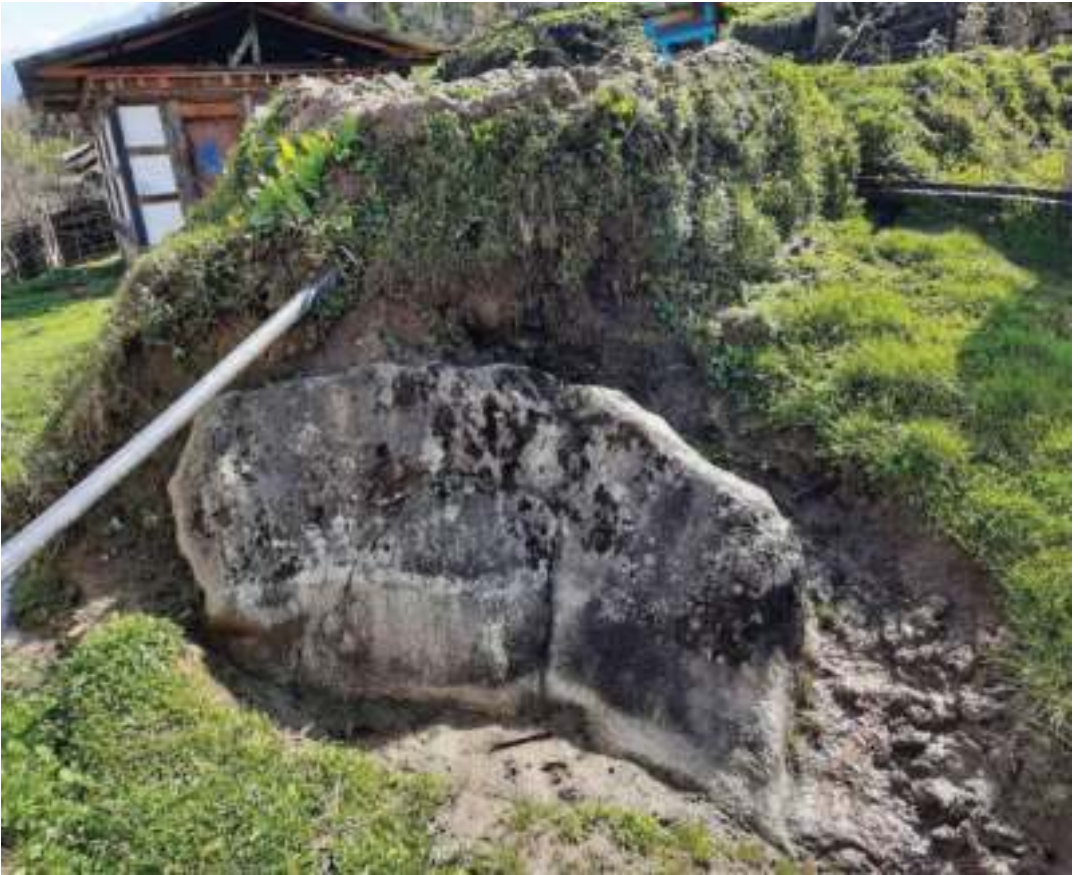
འཁོར་བསྐྱོན་སྤང་ཁྱུ་ཁྱུ་རྩ་ཇ།