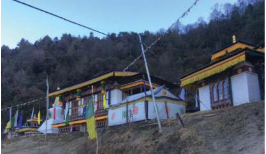
ཁུ་སྒོམ་དགོན་པ།