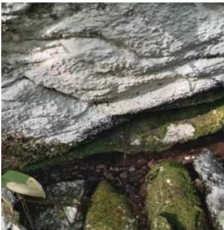
རྟུང་དཀར་བརྒྱ་ཙ་བརྒྱད།

གནས་བདག་གི་མིང་རྟུང་ཕུ་རྩེགས་པ་དབང་འདུས་ཟེར་སྒྲུབ་དགོ་མི་འདི་ཡང་ ས་གནས་འདི་ཁར་ རྟུང་ དཀར་གཡས་འབྲིལ་བརྒྱ་ཙ་བརྒྱད་གཉིར་ལུ་སྤྲ་བཞག་ཡོད་པ་སྤྱོད་སྤྱོད་མི་འདི་གིས་ རྟུང་ཕུ་ཟེར་སྒྲུབ་དོ་ཡོད་པ་ ད་ འཆང་མི་གི་གནས་འདི་ མོན་ཏྲ་མང་མང་འབྲེ་གི་ གནས་རྩ་ག་བྱང་གི་ གནས་མཚུག་ཨིན་མ་སྤྱོད་བཞག་མི་ འདུག།