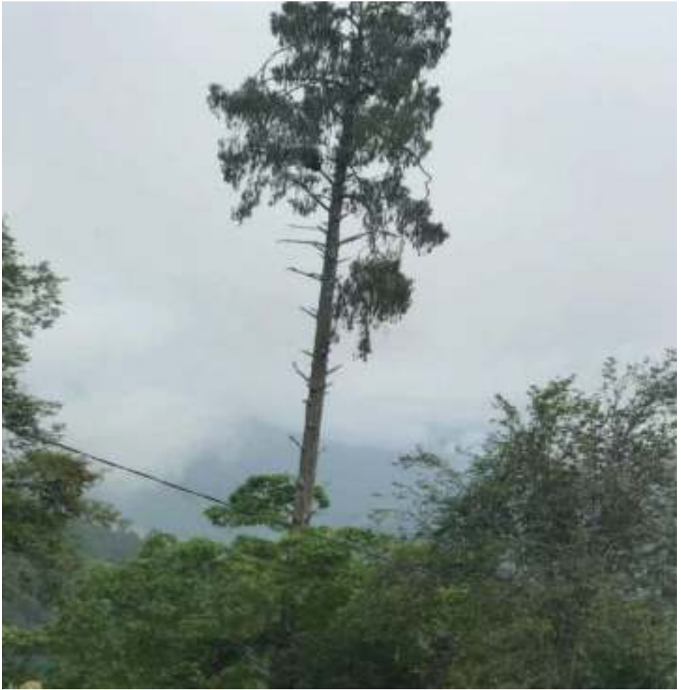
གཏེར་སྟོན་རྒྱ་སྒྲིང་པའི་ཕྱག་འཁར།