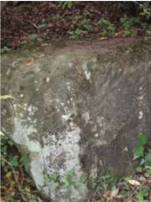
བཙན་ལུ་གསེར་སྤྱིམས་ཕུལ་སའི་སྤྱིགས་ཁྲི།