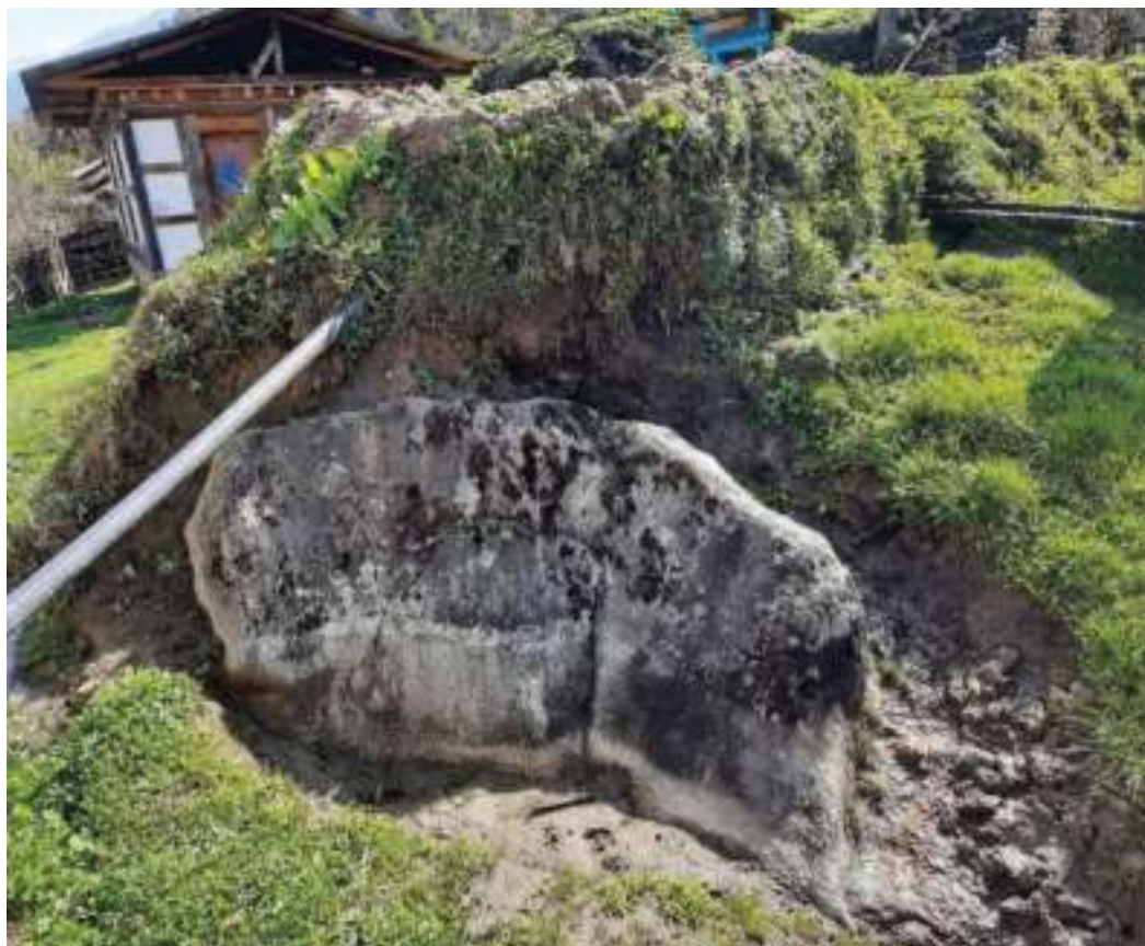
གནས་བདག་ཀྲ་ཀྲ་རྩ་ཇ།