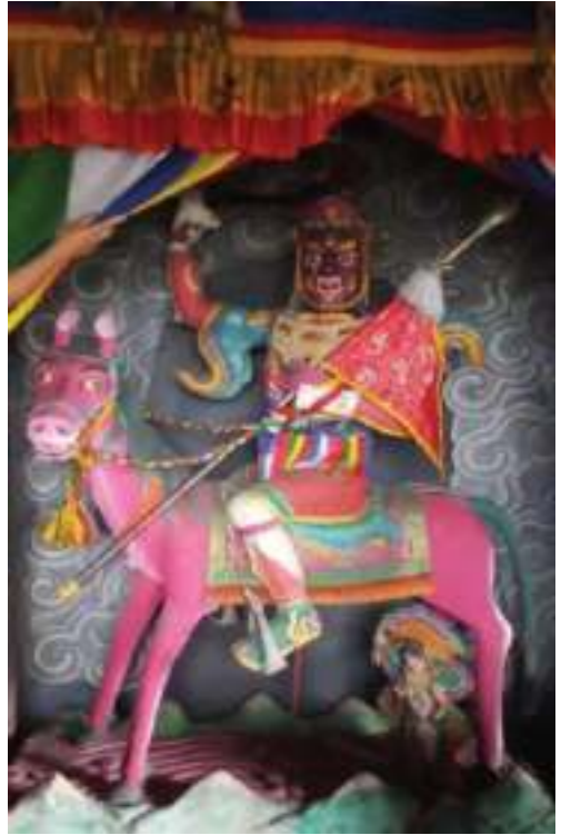
གཞུང་བཙན།

སྒོན་དང་ཕུ་འབད་བ་ཅིན་ ད་རེས་ཡོད་པའི་ལྷན་གྲུབ་ ཅེ་ལྷ་ཁང་དེ་ མི་སྣ་མཉམ་སྦྲེན་གྱིས་ཨིན་པས། ཨིན་ རུང་ དང་ཕུ་འབད་རྒྱུ་མཉམ་དེ་ རྒྱལ་འཕྲོ་བའི་ཤུལ་ ལས་ གཞུང་བཙན་གྱི་ཀོ་སྒྲོམ་དང་ ཅ་ཆས་གཞན་མི་ ཚུ་ག་ར་གྱིས་འདི་ནང་བསྐྱལ་ཞིན་ན་ ལྷ་ཁང་སྤེ་བའོ་ ཡོད་པ་ཨིན་པས། ལྷ་ཁང་དེ་ ཉམས་གསོ་ལུ་སྤེ་ ཡོ་ གངས་མ་སོང་ཏེ་འབད་རུང་ ཆར་པ་ཤུགས་བྲག་པའི་ ཁྱེན་ གྲང་ཚུ་ག་ར་མེད་པ་གཏང་དོ་ཡོད་པ་སྤེ་ཨིན་པས།